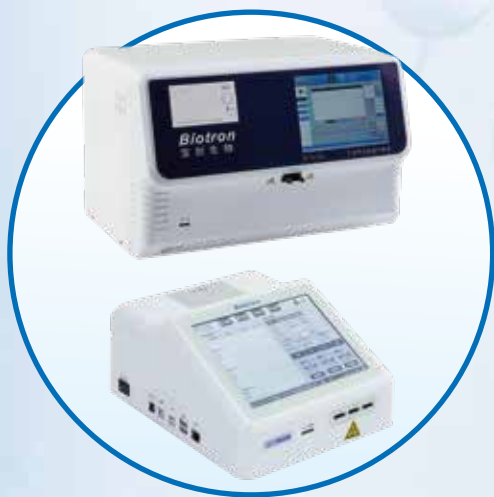
配套仪器：干式荧光免疫分析仪